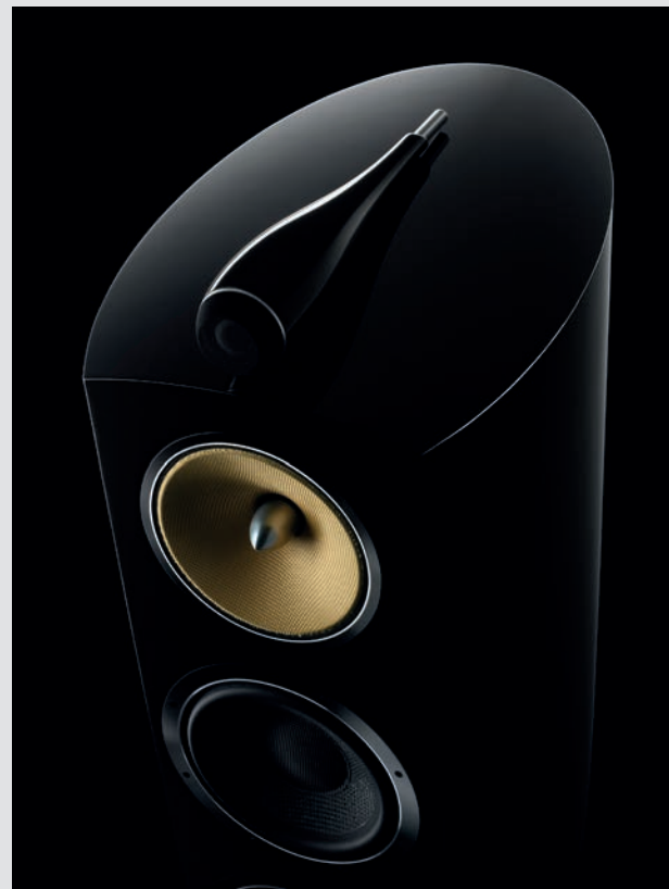
Lautsprecher der Highendserie 800 Diamond von Bowers & Wilkins

Dazu ein Raumklang, der jede Tonnuance so wiedergibt, wie sie einst im Studio abgemischt wurde, ohne Abweichung, ohne jede Verzerrung. So authentisch, dass der Betrachter schon mal den Kopf einzieht, wenn im Film etwas durch die Luft saust. Dass Technik und Techniker auch 3D können, wenn's