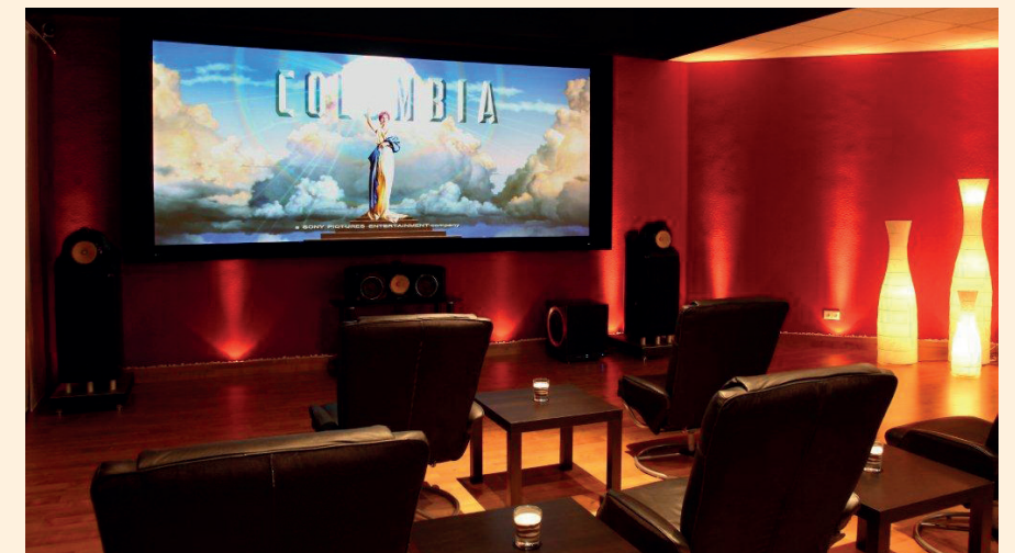
Highendkino der digital4home oHG in Dörth

Text: Eric Scherer, Fotos: digital4home , Schmitz Hifi-Video